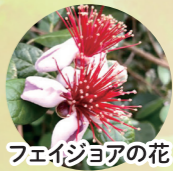
フェイジョアの花