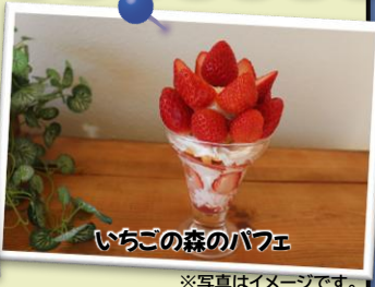
いちごの森のパフェ